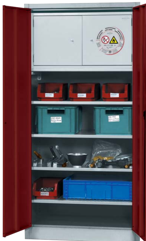
Armoire d'atelier modèle MF.195.95 avec 4 étagères galvanisées et 1 box de sécurité résistant au feu 30 minutes (norme NF EN 14470-1)